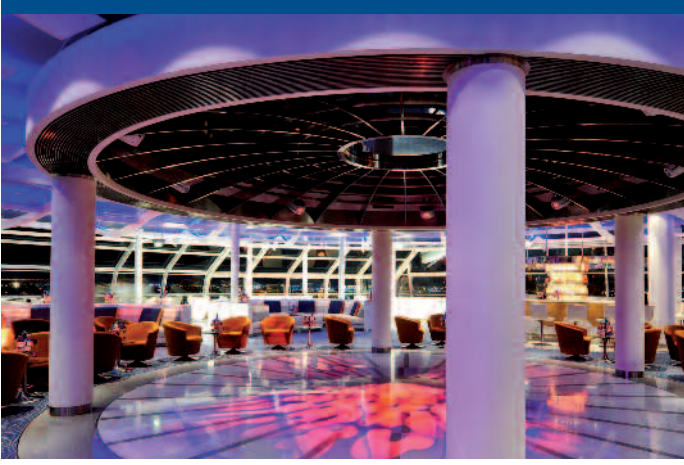
Luxuriöse „Sky Observation Lounge“ auf dem Celebrity Solstice-Kreuzfahrtschiff