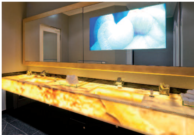
Nobles Bad im Bülow Palais Dresden

sichtbar stolz. Gerade im abgelaufenen Krisenjahr war ein solcher Mammutauftrag Gold wert. Eine anziehende Auftragslage erwarten die Gothaer nun vor allem im europäischen Hotelgeschäft, wo ein ständiger Sanierungsprozess überlebensnotwendig ist, von dem auch die Natursteinbranche profitiert. Gerade in diesem Bereich punkten die Thüringer mit einer neuen Pro-